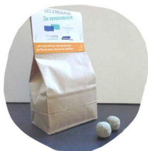
LA BONNE DOSE Grand sachet biodegradable 5m 2 de fleurs sauvages mellifères