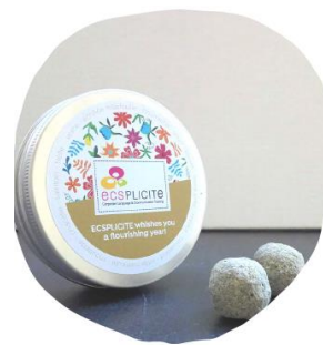
LA POUBELLE DE POCHE Boîte recyclable & réutilisable 1m 2 de fleurs sauvages mellifères