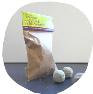
LE PETIT POUCKET Petit sachet biodegradable 1m 2 de fleurs sauvages mellifères